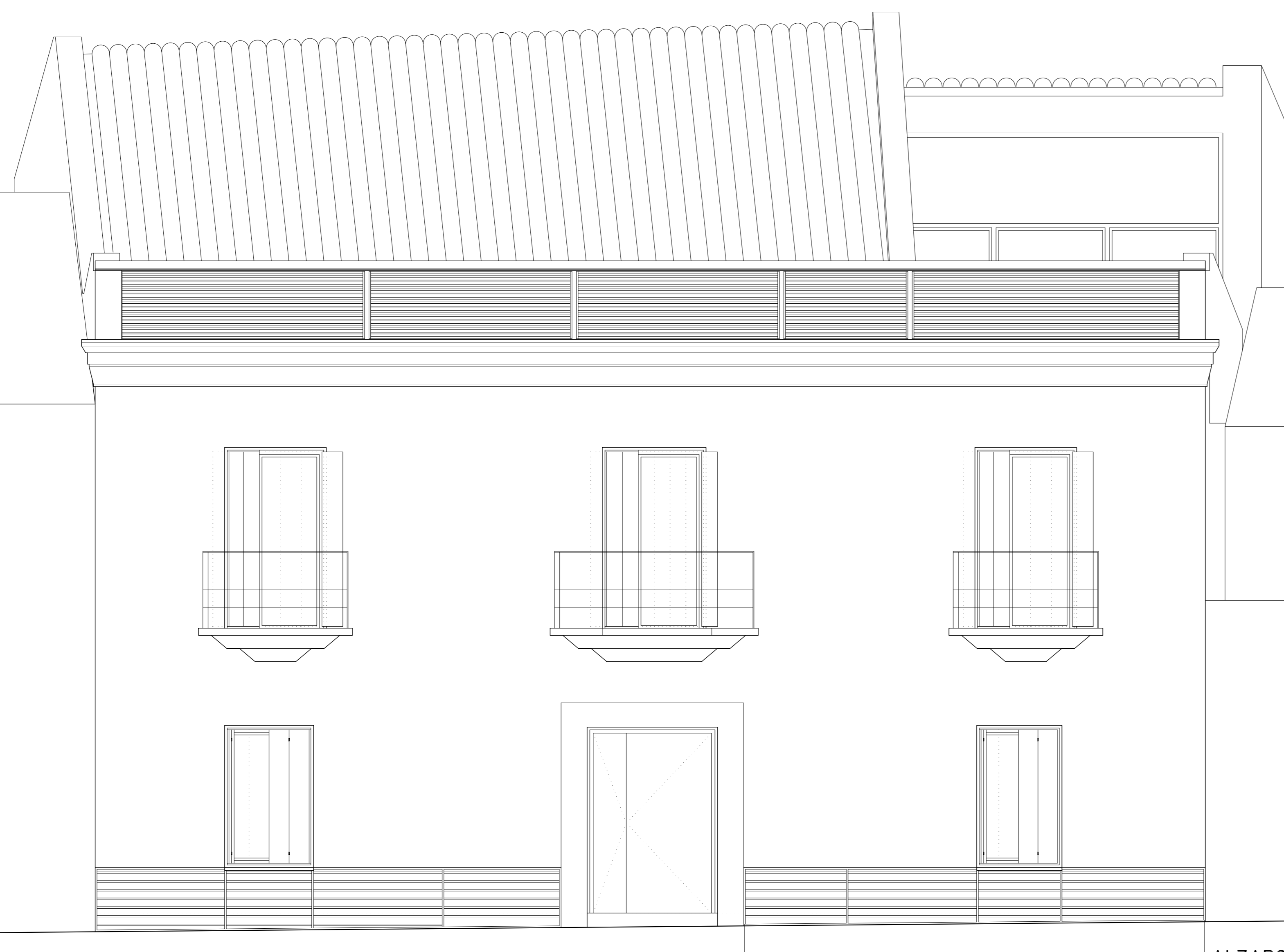
ALZADO C/ DEL MORAL e 1/50