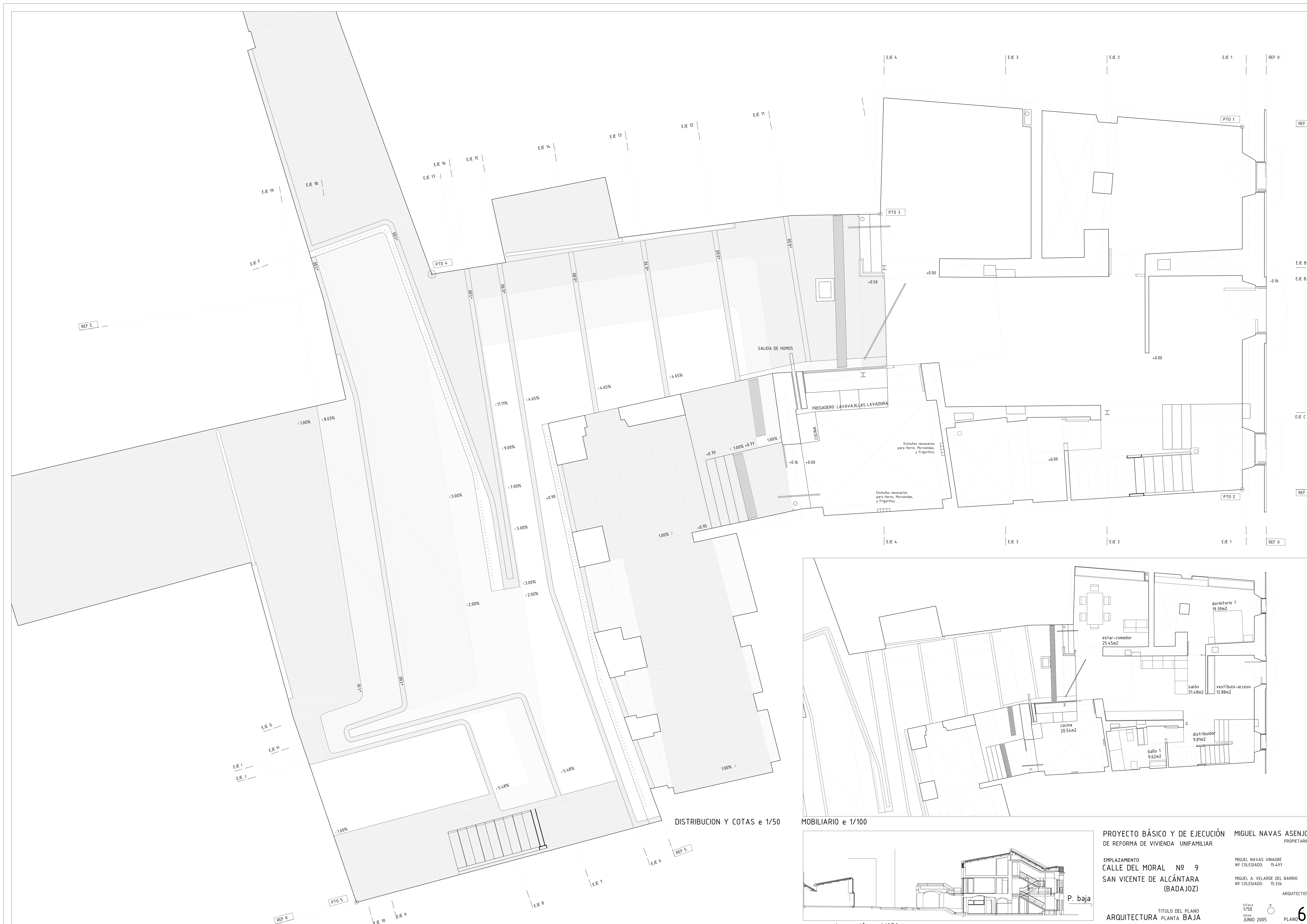
DISTRIBUCION Y COTAS e 1/50