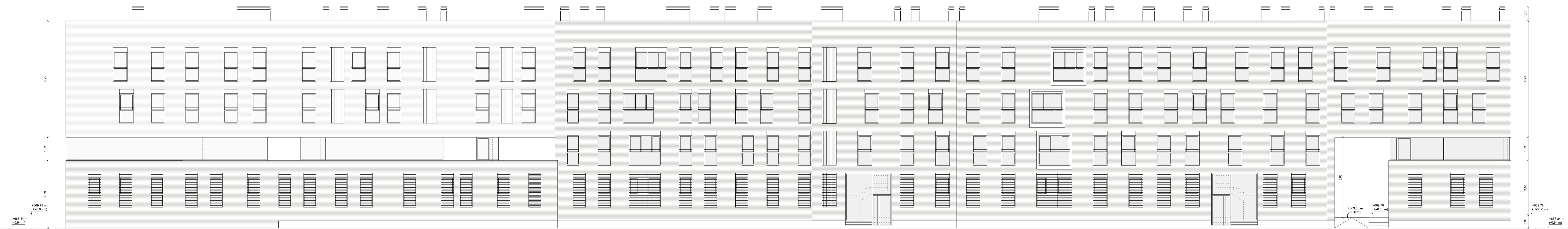
① Alzado oeste. Parcela A. E 1/100