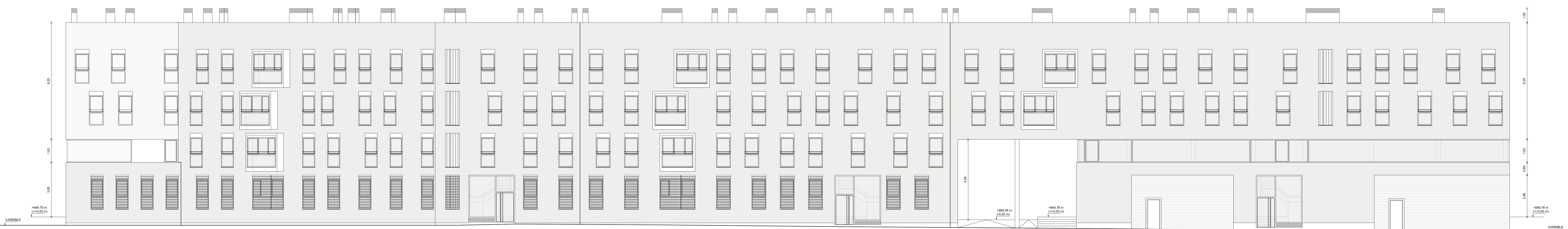
② Alzado este. Parcela A. E 1/100

PROYECTO BÁSICO 136 VIVIENDAS PÚBLICAS PROTEGIDAS DESTINADAS AL ARRENDAMIENTO, LOCALES, GARAJE Y TRASTEROS. PROMOTOR aygis aygis grupo s.l. - FORTALECIDO S.L. www.aygis.com - www.fortalecido.com - www.aygis.es ARQUITECTOS arquia arquitectos s.l.p. PÉREZ A. NAVAS VILLALBA PÉREZ A. NAVAS VILLALBA PÉREZ A. NAVAS VILLALBA www.arquiaarquitectos.com EMPLEZAMIENTO PARCELA FR 6-7-A Y FR 6-7-B DEL SECTOR "EL ARROYO", FUENLABRADA (MADRID) TÍTULO DEL PLANO ARQUITECTURA. PARCELA A. ALZADOS Y SECCIONES 1 artequia arquitectos s.l. ROSA M. GÓMEZ NÚÑEZ www.artequia.com - www.rosagomez.com - www.artequia.es ARTEQUIA 17100 Diciembre 2011 B13 PLANO